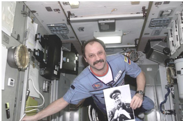
■ На борту Международной космической станции