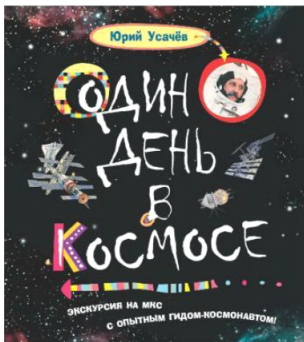
■ Многие фотографии, украшающие страницы книги «Один день в космосе», Юрий Усачёв сделал сам

Меня довольно часто спрашивают, что лучше — наш «Союз» или американские «Шаттлы». Могут сказать, что ни те и не другие. У американцев свои культурные и технические традиции, у нас — свои. Они пошли по пути многооразовых систем, преуспели в этом, создали несколько «Шаттлов». Мы пошли по пути долгосрочных орбитальных станций, но дешёвых одноразовых кораблей. Опыт показал, что одноразовый «Союз» гораздо эффективнее, чем многооразовый «Шаттл». В начале 2000-х, когда я летал в космос, один старт «Шаттла» стоил 600 миллионов долларов. Конечно, «Союз» несоизмеримо дешевле.