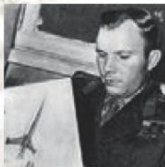
■ Во время обучения на лётчика в руки Юрия попал журнал «Знание — сила», посвящённый перспективам полёта на Луну. Номер так запомнился Гагарину, что после возвращения из космоса он заехал в редакцию, чтобы получить редкий выпуск в личное пользование.

Не терял Юрий и тяги к знаниям. Сохранилась запись в его дневнике, где он сетовал на свою