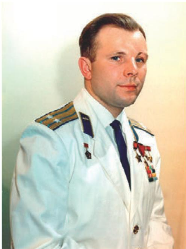
■ Юрий Алексеевич Гагарин, первый космонавт планеты Земля

Причины катастрофы до сих пор засекречены, что порождает слухи и теории заговора. Достоверно известно одно: космонавт и его инструктор до по-