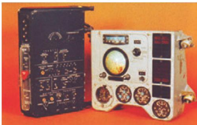
■ Пульт управления и приборная доска корабля «Восток»

Любой из шестёрки был готов к полёту. После обсуждений командование выделило троих: Юрия