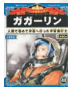
■ Японская манга о Юрии Гагарине