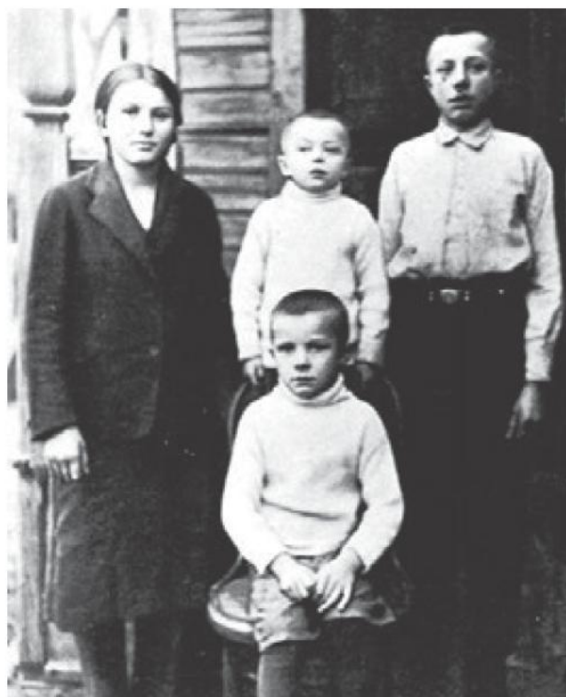
■ Младшие Гагарины: Юра (сидит) вместе с братьями Валентином, Борисом и сестрой Зоей