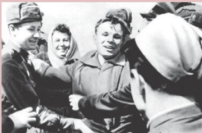
■ Юрий Гагарин после приземления среди военнослужащих ракетного дивизиона

Первый автограф Юрий дал командиру местной воинской части, который прибыл на место посадки. Космонавт расписался на партбилете военного, а тот подарил ему свою фуражку. В ней же Гагарин вышел из самолёта в Москве.