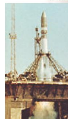
■ Старт космического корабля «Восток» с Юрием Гагариным на борту

Во время полёта Гагарин поддерживал связь с Землёй, записывал свои ощущения. Он восхищался красотой Земли и не скрывал восторгов. Также он пообедал (в меню были щавелевое пюре с мясом, паштет и шоколадный соус), убедившись, что питание в невесомости не вызывает трудностей.