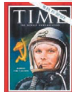
■ «Человек в космосе!» Обложка легендарного журнала Time от 21 апреля 1961 года

Заразительная жизнерадостная улыбка Юрия Гагарина — один из самых светлых символов XX века. Короткий космический рейс «Востока» — веха, после которой наша цивилизация обрела новый смысл. И благодаря Гагарину каждый из нас получил шанс внести свой вклад в покорение Вселенной. 🚀