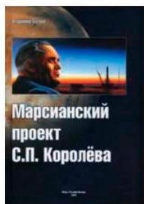
Издательство: «Русские витязи», 2009 200 стр., 1000 экз.

Итог: интереснейший исторический труд о советской программе межпланетных экспедиций.