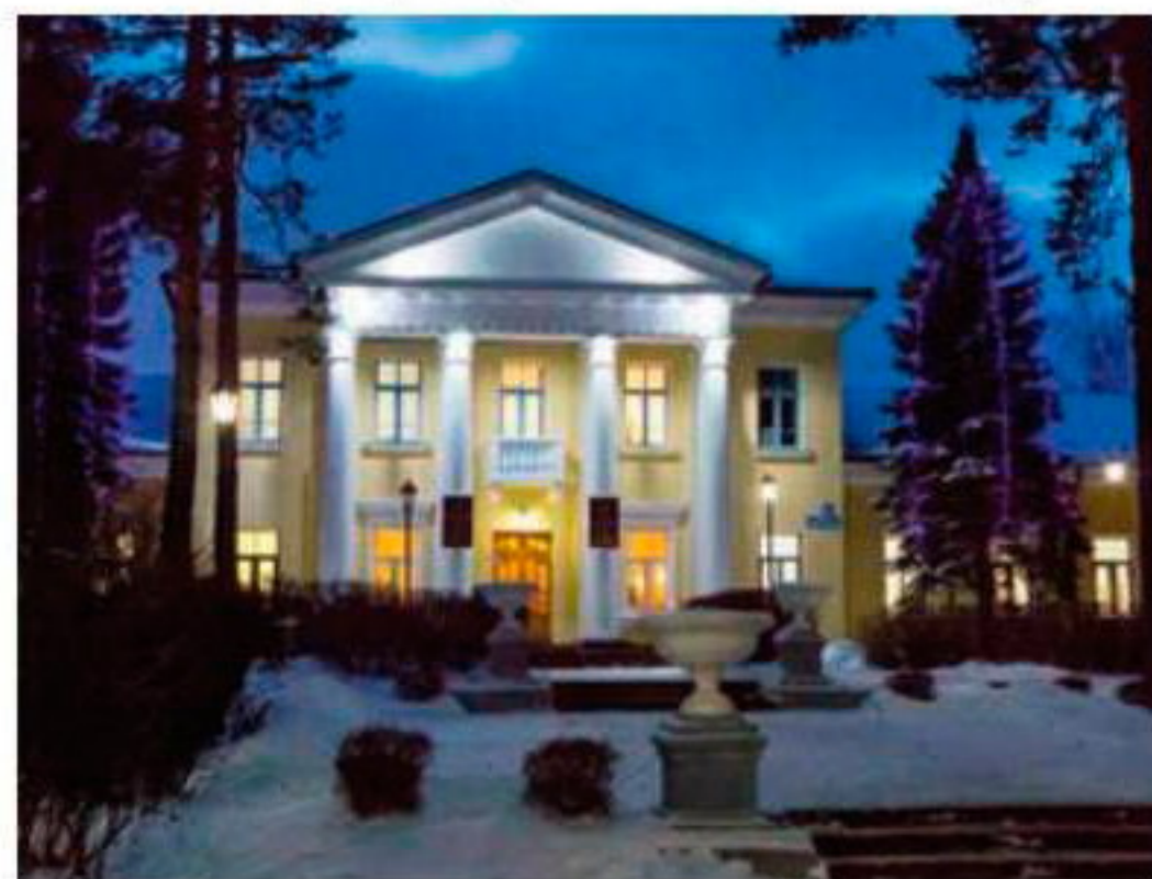
■ Центр ядерных исследований в Дубне

В начале XX века учёные полагали, что самый тяжёлый элемент в природе — уран (92-й элемент таблицы Менделеева). При этом не исключалось существование ещё более тяжёлых «трансуранов». Многие химики и физики пытались получить их, но только в 1940 году было официально признано открытие нептуния (93-й элемент) и плутония (94-й элемент). Причём изначально оба «трансурановых» элемента были получены искусственно