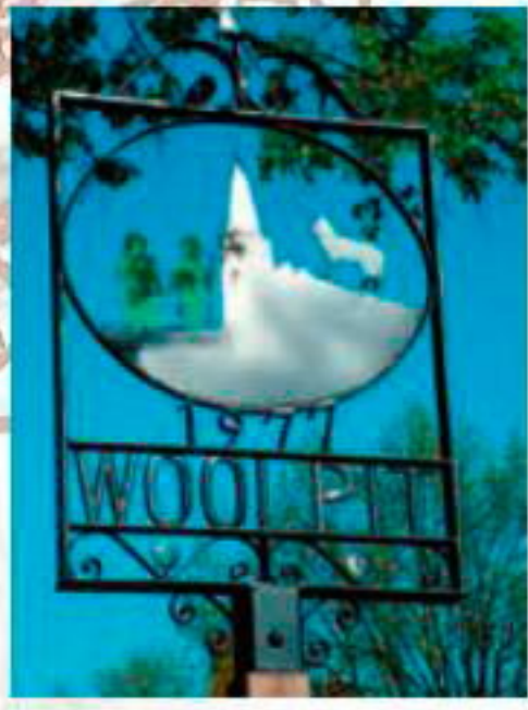
■ Герб Вулпита украшают зелёные фигурки мальчика и девочки