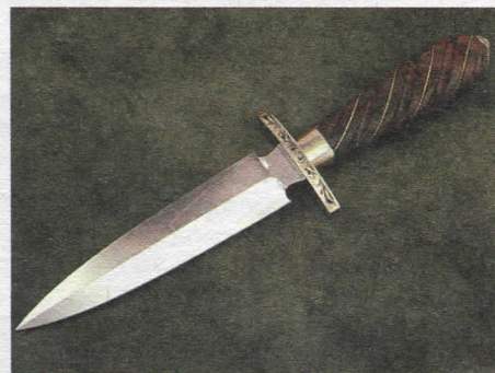
Атам – двусторонний нож с черной рукояткой, выполняющий в процессе колдовства особую роль

Таким образом, Берия дал понять Мессингу, что главной его работой в Советском Союзе будут не эстрадные выступления, а наблюдения за «здоровьем вождя». Но чем тут мог помочь Мессинг, который даже не имел медицинского образования? Наверное, только одним. «Менталист» мог заметить то, чего не увидит ни один врач, а именно – последствия разрушительного психофизического воздействия, легкие нарушения в моторике вождя, несоответствие его поведения определенному эталону.