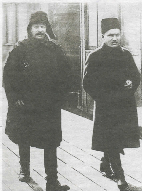
С Сергеем Кировым у «отца народов» сложились очень доверительные отношения