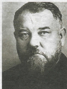
Начальник Ленинградского управления НКВД Филипп Медведь по просьбе Кирова нашел для Сталина «специалиста» по магии и колдовству

Очевидцы, общавшиеся с Иосифом Сталиным, свидетельствуют: до самой смерти он продолжал интересоваться эзотерической литературой, читал соответствующие переводы, делал пометки на полях книг, запрещенных в СССР к широкому распространению.