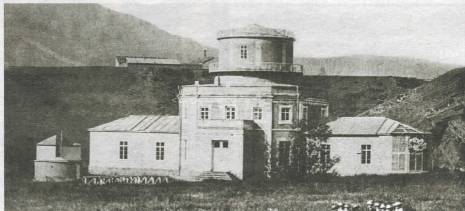
Тифлисская обсерватория: здесь молодой Сталин постигал основы марксизма

Видимо, этот инструмент помогал магу сконцентрировать свою «колдовскую мощь» в невидимый луч.