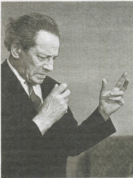
Вольф Мессинг в своих воспоминаниях о Сталине почти ничего не рассказывал, хотя его способности вождь высоко ценил

двойники или облагороженный образ, который никак не может быть использован врагами для энвольтования. А единственная подлинная фотография вождя, которую Сталин дарил на память гостям и знакомым, абсолютно защищена от любых «магических» воздействий – он сфотографирован на ней вполоборота, сощурившись и раскуривая трубку. Глаза – самое уязвимое в оккультном смысле место человека – на этом снимке прикрыты, а так называемый «внешний энергетический контур» защищен огнем.