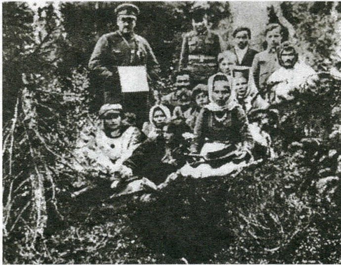
В поисках мистических артефактов экспедиции НКВД собирались до северных морей

Зимой 1924 года Глеб Бокий привлек к работе на Спецотдел ученого-мистика Александра Барченко. Основные научные интересы этого исследователя были сосредото-