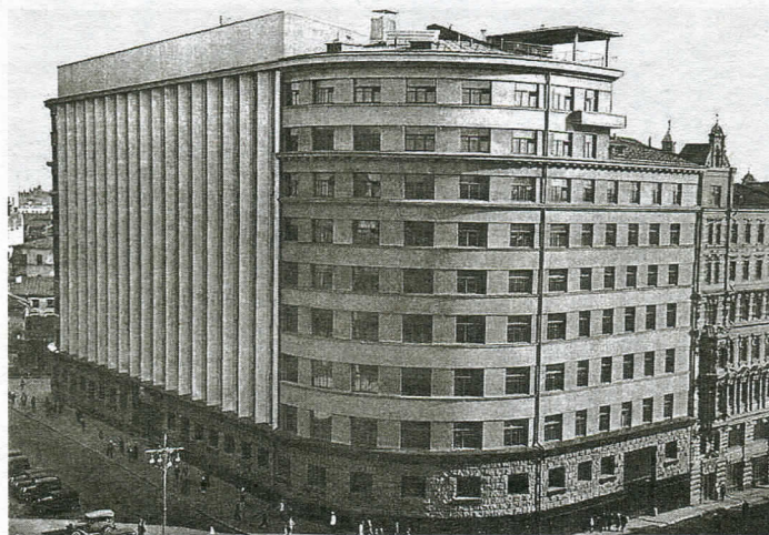
В этом здании в центре столицы располагалась секретная лаборатория НКВД