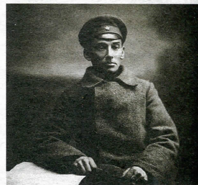
Глеб Бокий – начальник Спецотдела НКВД