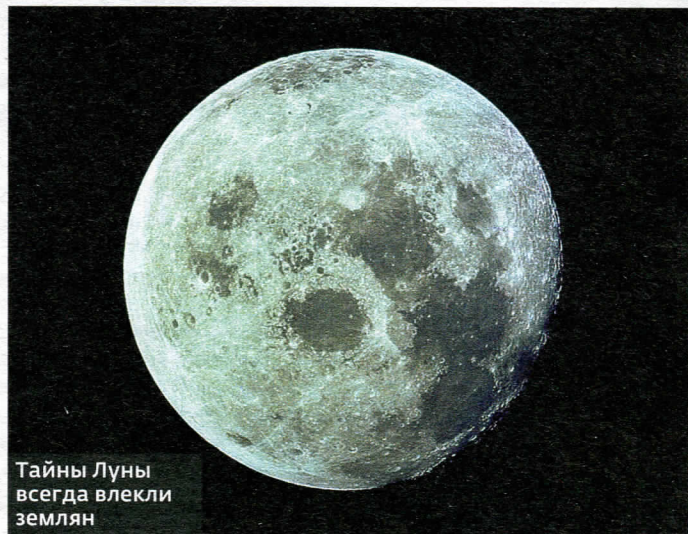
Тайны Луны всегда влекли землян