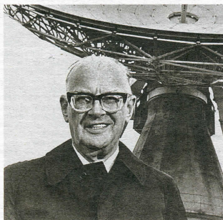
Артур Кларк – великий фантаст был отличным инженером

Позднее проект Diana породил военную программу PAMOR (Passive Moon Relay), нацеленную на поиск отраженных сигналов советских радиолокационных станций: американские военные полагали, что таким способом можно точно установить местонахождение не только советских радаров, но и зоны хранения ядерных боеприпасов. Интересное применение «лунной» радиолокации нашлось в период с 1954 по 1962 годы: американский