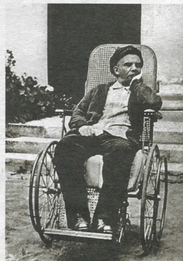
Последние два года жизни Ленин был глубоко болен. Официальной причиной было объявлено кровоизлияние в мозг

Работа шла бодро и освещалась в советской прессе. Но случился казус. В 1929 году Фогт выступил со своими сообщениями в Германии, где продемонстрировал тончайший срез с мозга Ленина. Коллеги раскритиковали выводы исследователя, в частности указав, что пирамидальные клетки мозга Ленина, которые Фогт считал признаком особого типа интеллекта, чаще всего встречаются у... слабоумных.