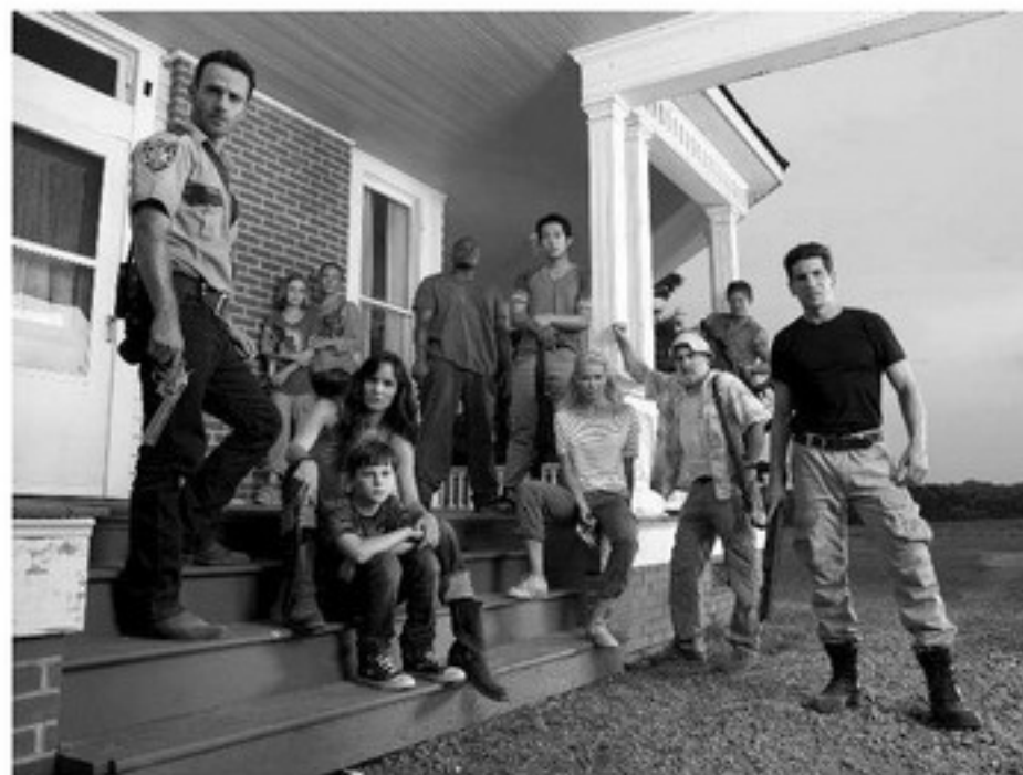
Актеры телесериала «Ходячие мертвецы»

Выскажу гипотезу. По тому, какие образы мертвецов становятся наиболее популярными у масс в тот или иной момент времени, можно сделать вывод, на каком этапе разви-