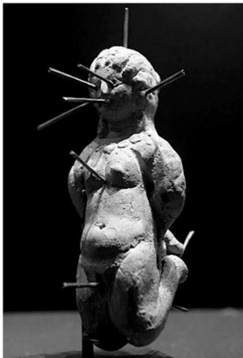
Кукла-проклятие, пронзенная 13 спицами (вуду-кукла). Найдено в Египте. II век н.э.

Создание зомби — одна из магических практик жрецов культа Вуду, называемых «бокорами». Чтобы заставить тело умершего человека беспрекословно выполнять приказы, колдуну нужно сначала похитить душу будущего зомби. Душа находится в теле только при жизни, поэтому похищение нужно осуществить, когда человек еще вполне здоров. Для этого ночью, когда намеченная жертва спит, бокор подкрадывается к двери его дома (важно, чтобы дверь была деревянной и имела щели), прикладывает губы к створке и «высасывает» душу спящего. Затем душу помещает в специальный (чаще всего стеклянный) сосуд, который тщательно закупоривается. С этого момента судьба человека предрешена: без души тело не способно к жизни, и спящий не проснется. После похорон бокор приходит к могиле умершего, раскапывает ее и точно в